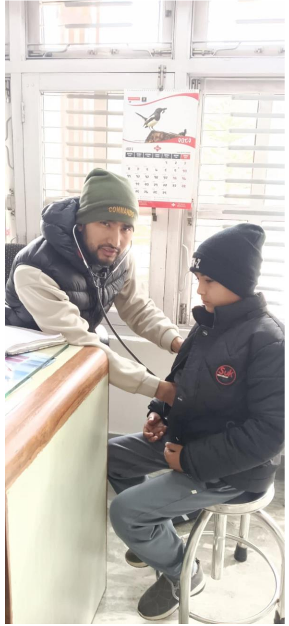
Kinder litten an Erkältung und Grippe.