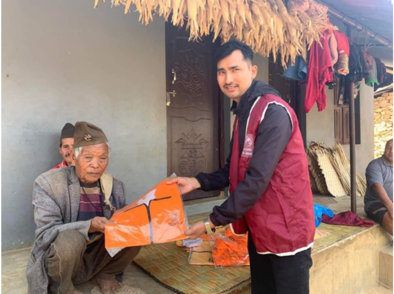
HILFE ZUR HILFE IN NEPAL: Stoffverteilungsprogramm.