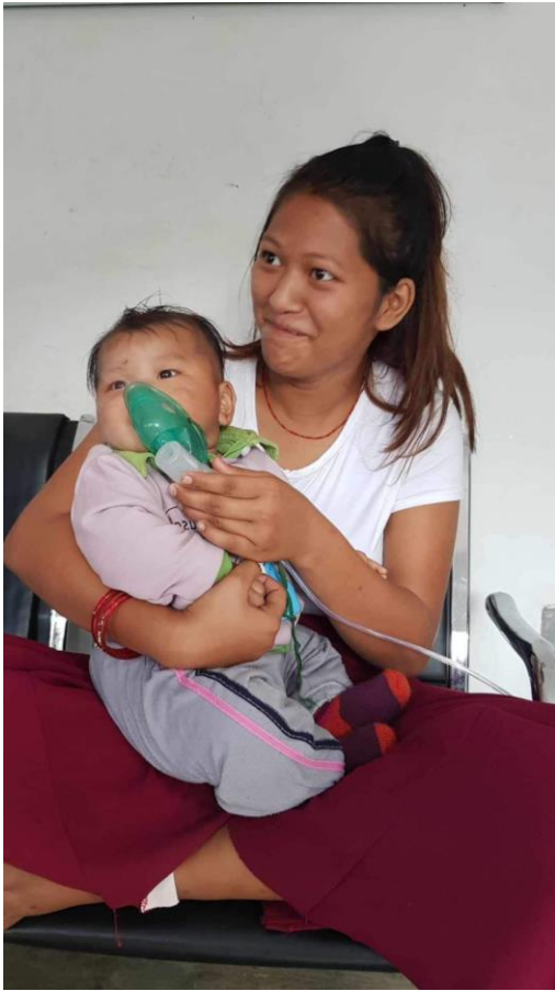
Smilly-Mutter mit ihrem Baby, nachdem sie ihr Baby besser behandelt hat.